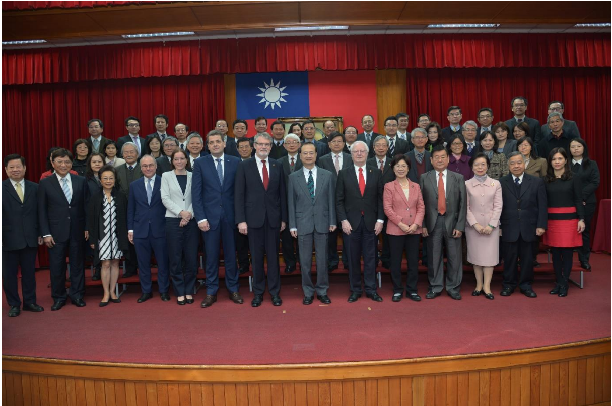
Teilnehmer der Festveranstaltung